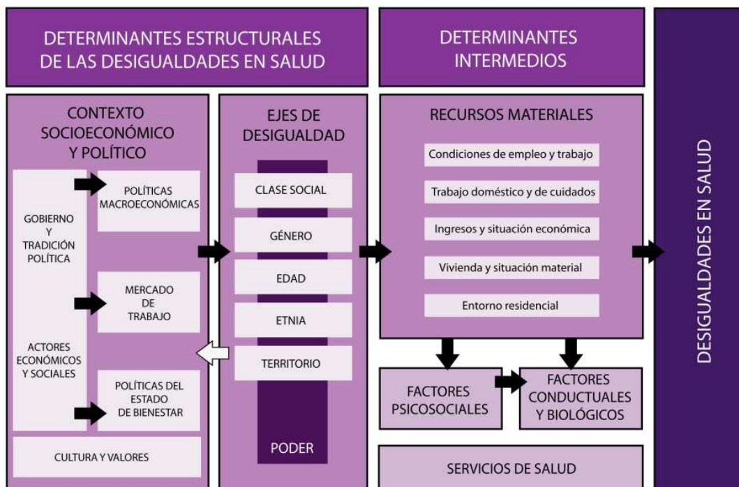
Taula 1. Recomanacions de la Comisión para Reducir las Desigualdades en Salud en España